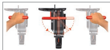
Poignée réglable pour droitier et gaucher Orientable handle for right-handed and left-handed users Verstellbarer Griff für Rechts- und Linkshänder