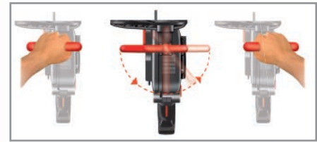
Maniglia orientabile per destrimani e mancini Orientable handle for right-handed and left-handed users Manija orientable para usuarios diestros y zurdos