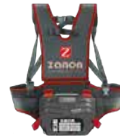
DRIVE 600.S LI-ION BATTERY