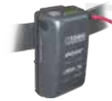
DRIVE 300.S LI-ION BATTERY