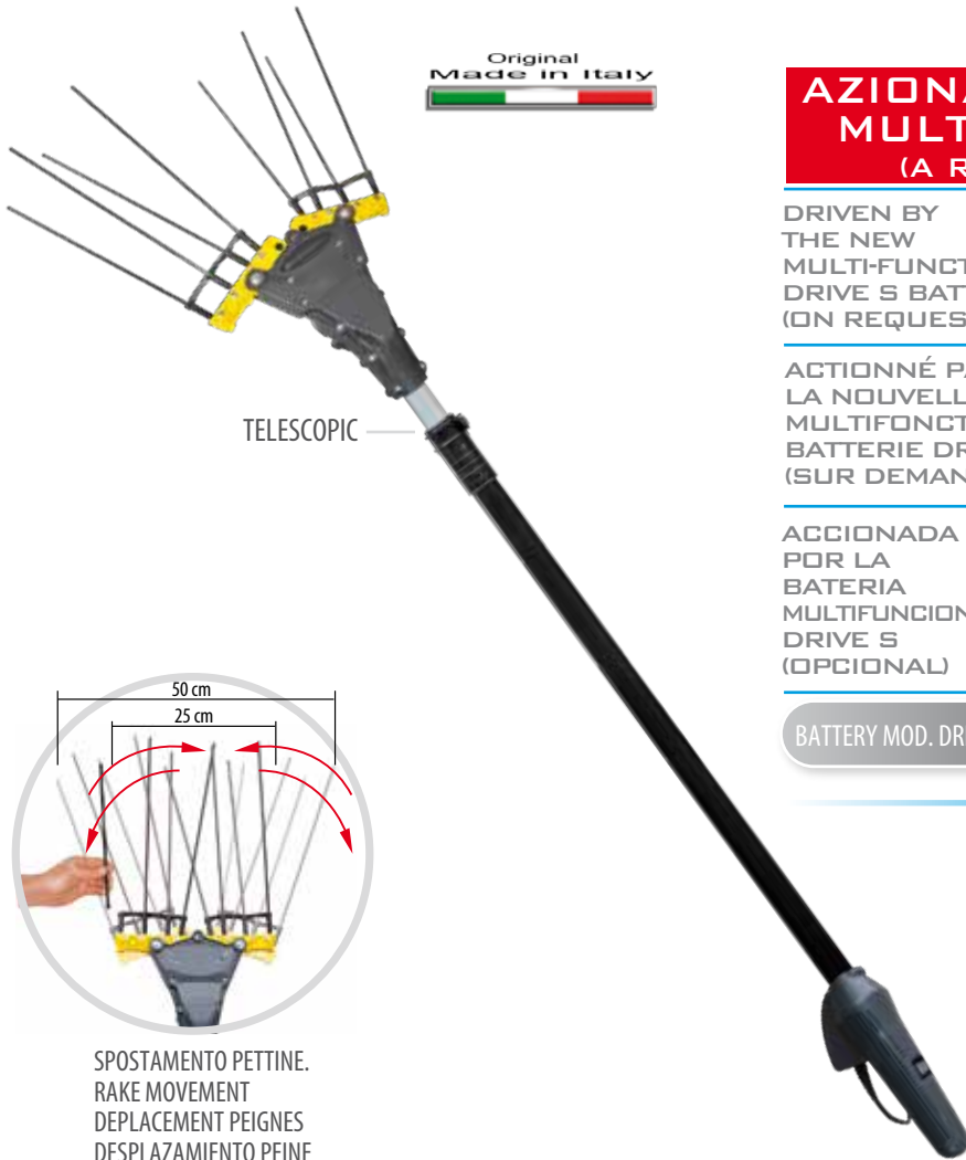
DRIVE 2000.S LI-ION BATTERY