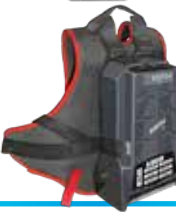
DRIVE 1300.S LI-ION BATTERY