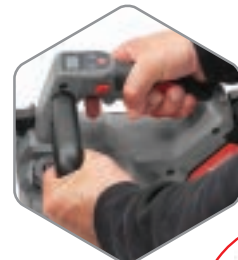
Dispositivo anti-contraccolpo elettronico Electronic anti-kickback device Dispositivo anti-retroceso electrónico

A richiesta On request Bajo pedido Cod. 3250314