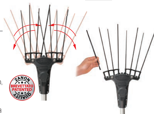
Bacchette in carbonio di facile e rapida sostituzione Easy and quick replacement carbon rods Dientes de carbono con sistema de cambio fácil y rápido